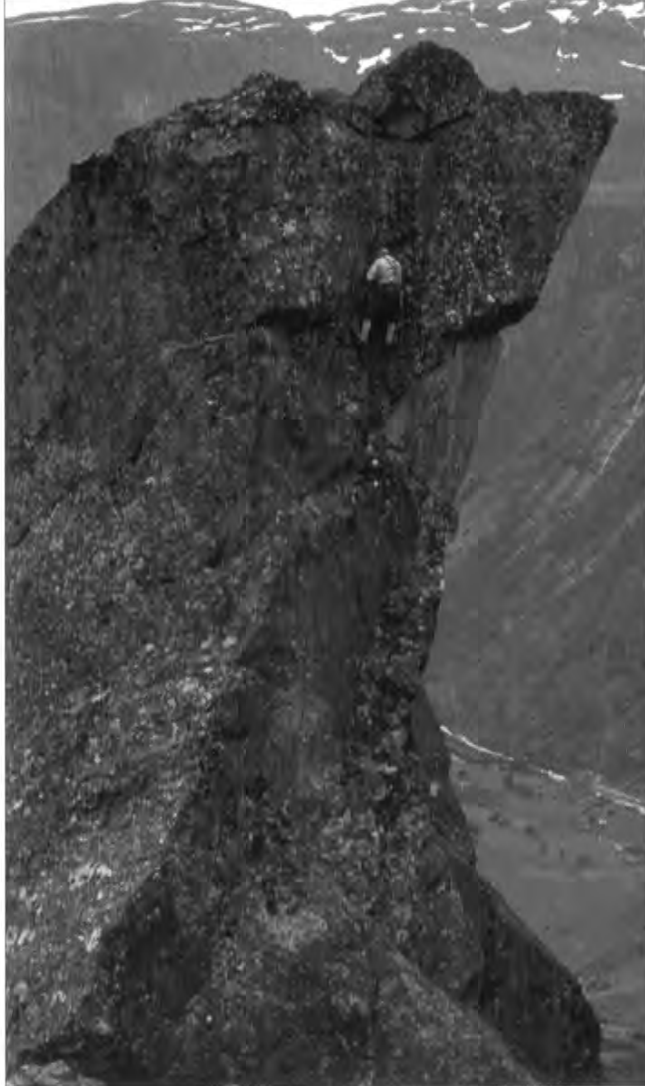
TUSSEFOTEN, ØVRE EIDFJORD.